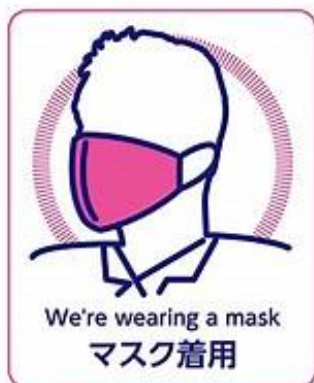
従業員のマスクの着用