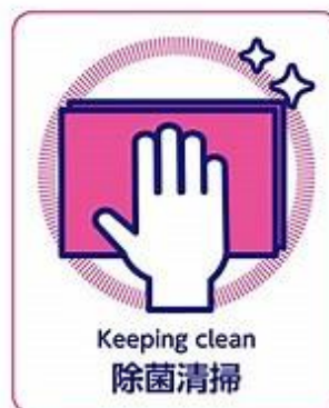
椅子・テーブル・備品などの消毒の徹底