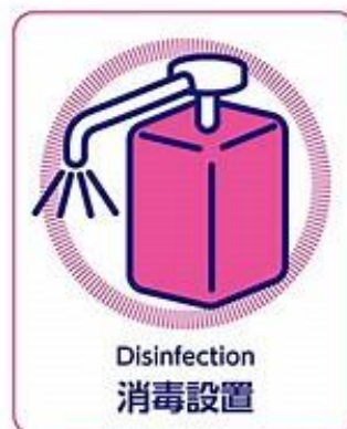
店内入り口のアルコール消毒をご利用ください