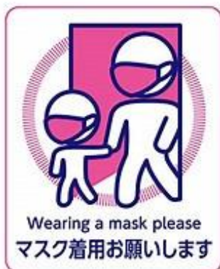
来店時はマスクの着用をお願いします